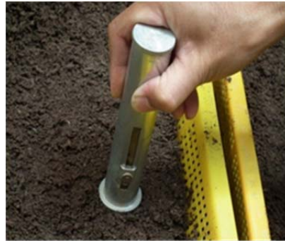
圖 5 硬度檢測情形 Fig.5 Hardness measuring condition