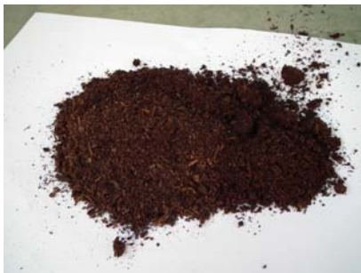
圖 1 菇類堆肥

菇類堆肥，是香菇採收後之剩餘栽培材料，廢棄之太空包，經堆肥發酵後成為纖維材料，主要的成份為約 95%的天然木屑，然後再添加米糠，玉米粉，麥粉…等五穀類有機物混合。