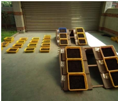
圖 4 試驗區配置情形 Fig.4 Testing plot

濕篩法為評估土壤團粒在水中之穩定性的普遍方法，將各組配方過篩，取粒徑在 2-5mm 的部分做團粒穩定分析；假設其他部分之團粒穩定度沒有很大之差異。進行濕篩時，使土壤透過多組篩網，每分鐘在水中有頻率的上下振動 30 次，並停留在各篩網上；將每一停留在篩網之土壤置於室內風乾，待乾燥後倒入燒杯，再進行 105°C 烘乾，並量其乾重，藉由滯留在各篩網上之土壤停留量，來比較土壤團粒對於水分沖蝕破壞的抵抗力。計算各粒徑團粒之重量累積百分率，點繪於對數-百分比統計圖表上，以對數幾何平均粒徑與對數標準偏差代表團粒在水中之穩定度。在 13 組噴植基材之土壤粒徑分佈之情形，求出其對數幾何平均粒徑，以進一步瞭解各組噴植基材配方，探討何組具有較穩定的團粒構造（如圖 7）。