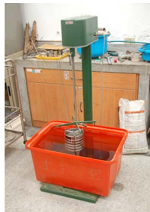
圖 7 濕篩試驗 Fig.7 Wet-sieving test