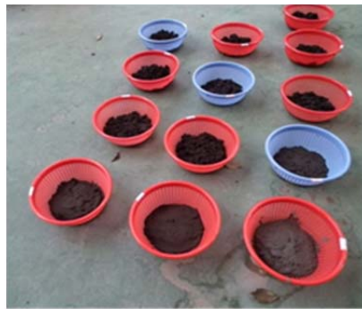
圖 6 保水力試驗 Fig.6 Water content test configuring