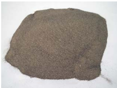
圖 2 壤質砂土