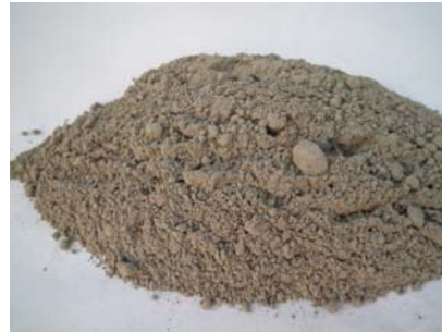
圖 3 波特蘭水泥（第 I 型普通水泥）